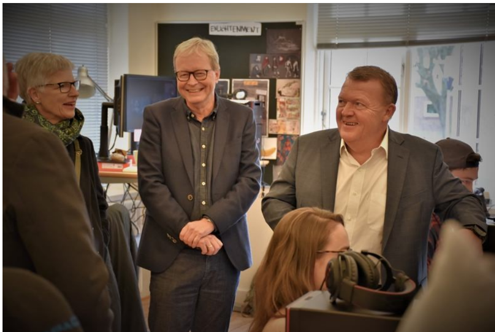
Besøg på Animation Workshop under valgkampen