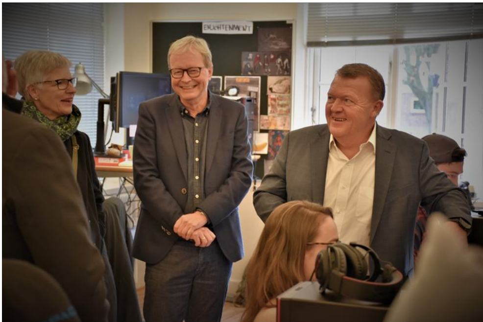
Besøg på Animation Workshop under valgkampen